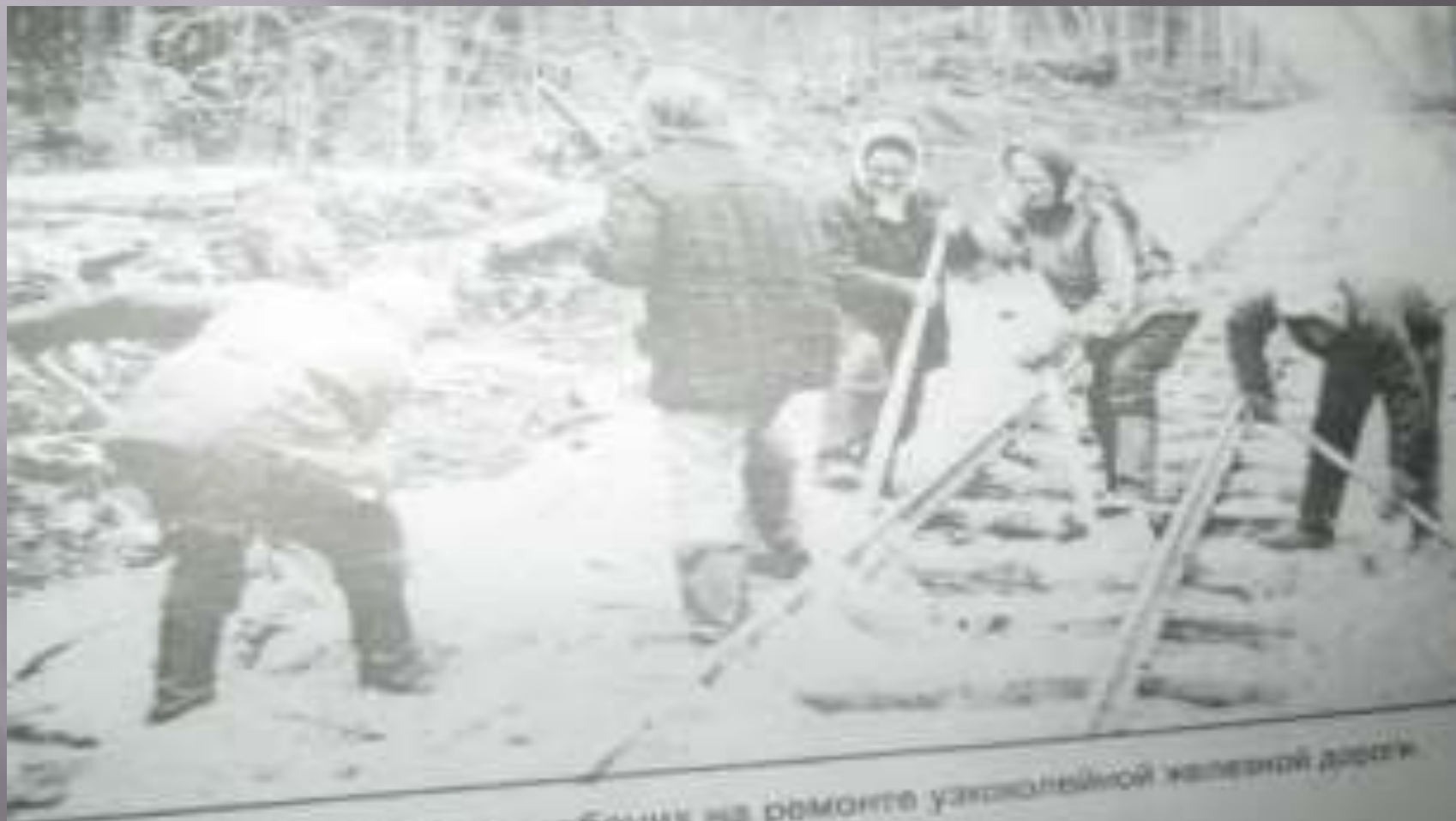
Бригада путевых рабочих на ремонте узкоколейной железной дороги